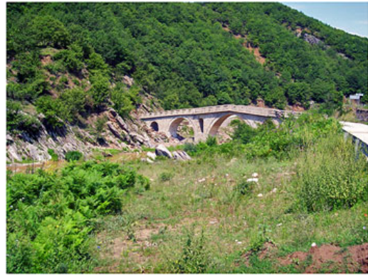
Grecia, Tracia: Xanthi dintorni 2.VII.2009