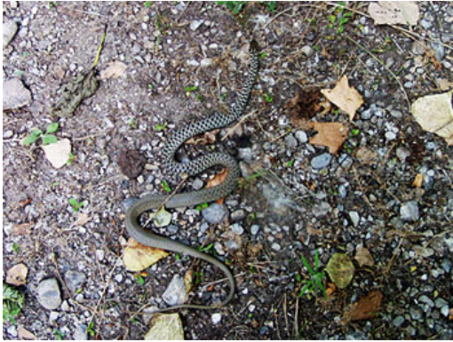
Hierophis cfr. gemonensis

Il viaggio volge al termine, prendiamo la strada del ritorno, di nuovo attraverso il Passo di Katara (2 luglio) dove riesco a compiere ancora alcune osservazioni sulla Rana verde maggiore ( Rana ridibunda ) che ho trovato in alcuni laghetti con le uova appena deposte.