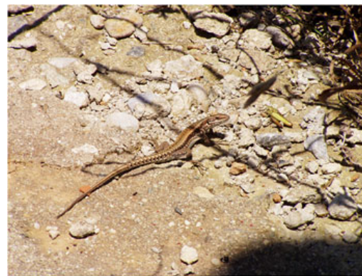
Podarcis cfr. erhardii