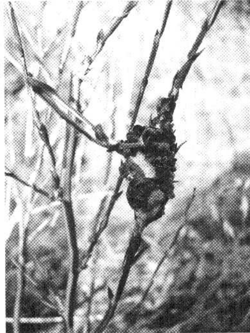
Fig. 2 — Galla di T. phoenixopodos in natura.

Timaspis phoenixopodos , DE STEFANI PEREZ, 1912: 63 (Sicilia: contrada Favare, versante orientale delle Madonie).