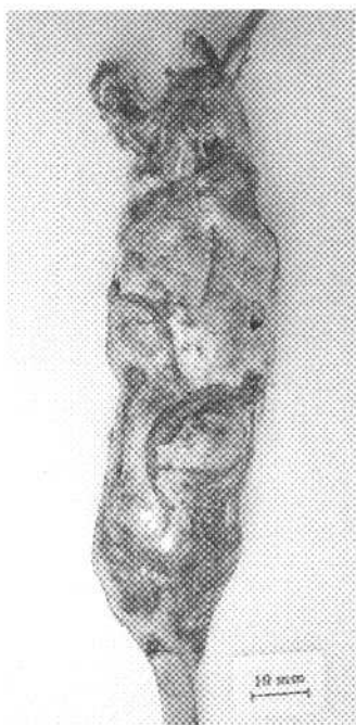
Fig. 3 — Galla di T. phoenixopodos .

Materiale esaminato. — Sicilia, Catania, Monte Etna: Mascalucia, Massannunziata, Bosco di Monte Ciraulo, m 500 s.l.m., 6 esemplari ottenuti da galla il 15.II.2003 (G. F. Turrisi leg.); Monte Etna: Pedara, m 600 s.l.m., 3 esemplari ottenuti da galle il 2.V.2001 (S. Arcidiacono leg.); Monte Etna: Maletto, contrada Fontanamurata, m 1000 s.l.m., numerose galle prelevate il 29.VI.2003 (G. F. Turrisi leg.).